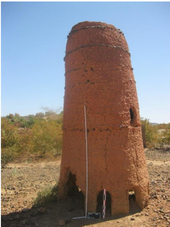
Fig.9. Vue du fourneau de Ronguin (Bam)