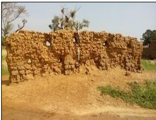
Fig. 5. Les ruines des murailles de Sati

En plus des enceintes en argile et en pierre, nous avons également des sites d'habitat en pleine air qui ne sont rien d'autre que des lieux qui rendent témoignage d'une occupation ancienne du territoire (Cf. figures 7 et 8). Les sites d'habitat jalonnent l'ensemble du territoire national, signe d'une dynamique d'occupation de l'espace, comme s'ils suivaient les multiples processions migratoires des peuples. Ces sites dont les auteurs restent pour la plupart méconnus se présentent sous forme de buttes avec des surfaces le plus souvent jonchées de céramiques fragmentaires ou entières aux décors variés, autres franges très importantes du mobilier archéologique burkinabè sur lesquelles plusieurs études ont été consacrées.