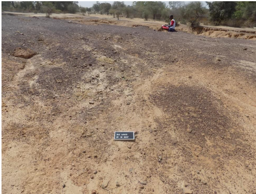
Fig.13. Vue du site P17 A1