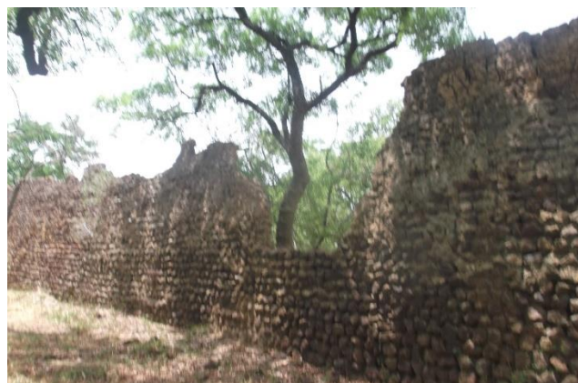
Fig.6. Les ruines de Loropéni