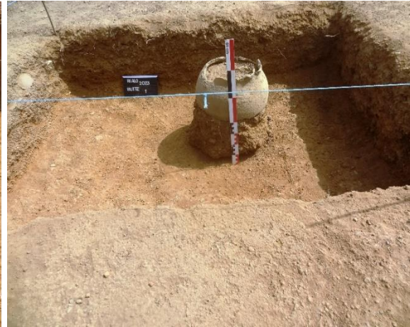
Fig. 8. Poterie entière mise au jour sur la butte de Nadialo