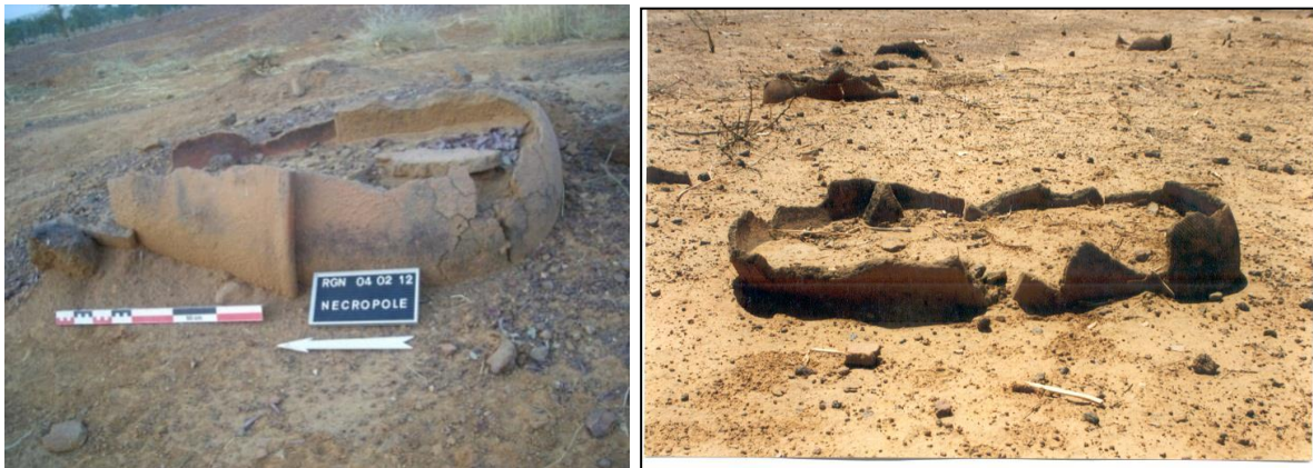
Fig.11 et 12. Vues des jarres cercueils sur la nécropole N°3 de Ronguin