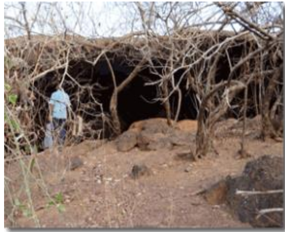
Fig. 2. Abris sous roche de Margo