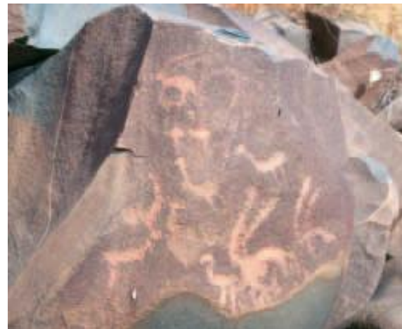
Fig.4. Oryx et autruches