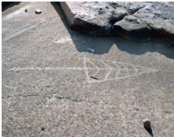
Fig. 3. Lance