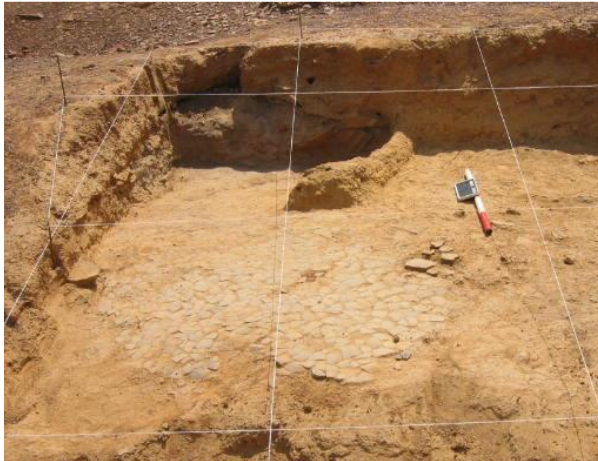
Fig.7. Vue partielle de la fouille du niveau II de la butte de Wargoandga