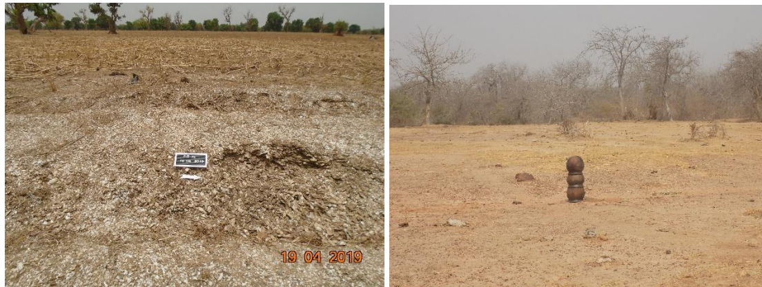
Fig.13. Vues des site AM15 et AV5