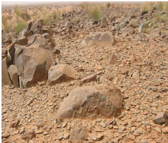
Fig. 1. Un atelier de débitage lithique