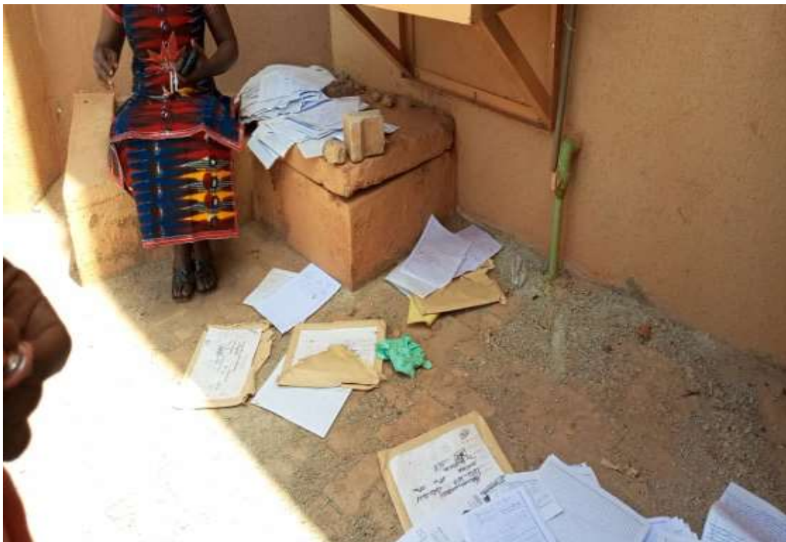
Cliché1 de Monsieur LOMPO D. U. pris le 03 novembre 2023 : Des copies à côté de l'amphi

La troisième observation c'est à la devanture d'un amphithéâtre que nous avons constaté des copies éparpillées et à côté l'enveloppe qui était censée les contenir (voir photos ci-dessous).